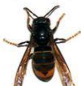
Frelon asiatique (Vespa velutina)