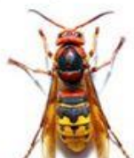
Frelon européen (Vespa crabro)