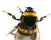
Bourdon terrestre (Bombus terrestris)